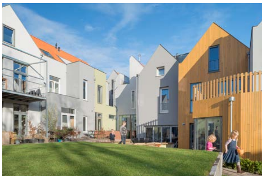
Sint Martenshof