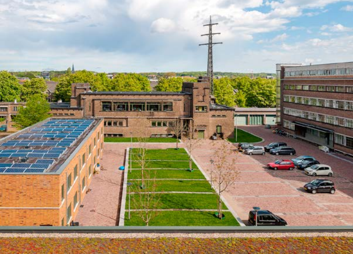
De Transformatie

duele woonwensen die desalniettemin een geheel vormen. We zijn hier getuige van een democratisering van de architectuur waar architect, aannemer, corporatie en last but not least de bewoners zelf samen verantwoordelijk voor zijn. In de interactie tussen architect en opdrachtgevers is bovendien een spannend architectonisch beeld ontstaan op het snijvlak van nieuwbouw en historie.