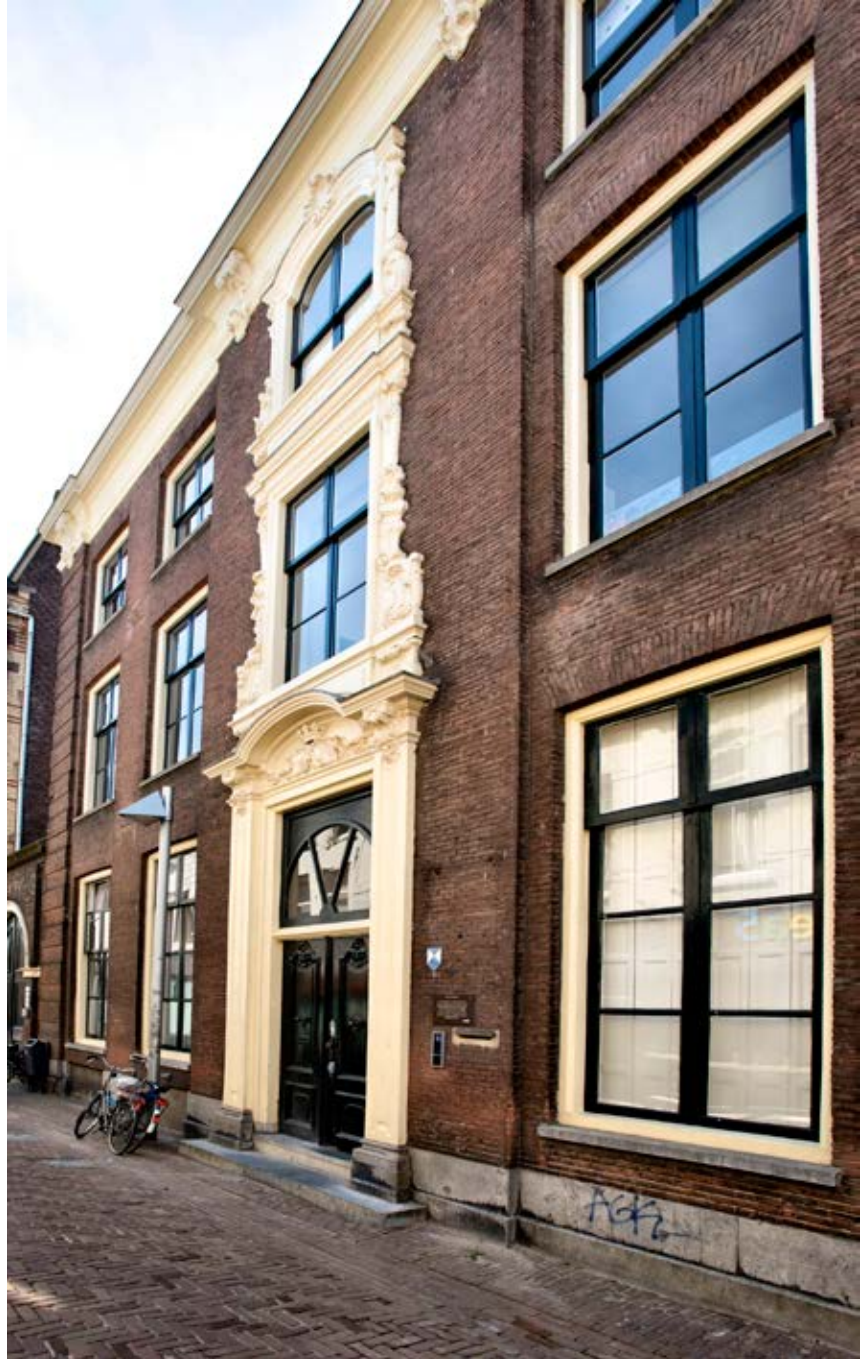
De Mariënborg

Adres: Van Oldenbarneveldtstraat 90-92 Architect: TAK Architecten en K3 Architectuur Opdrachtgever: Volkshuisvesting Arnhem en KuiperArnhem Bouw en Ontwikkeling