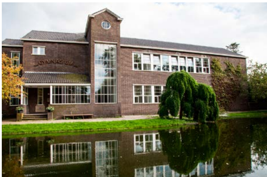
De Kleine Campus