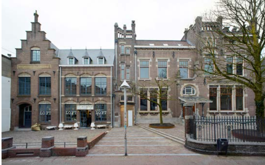
Weverstraat 39 – 40