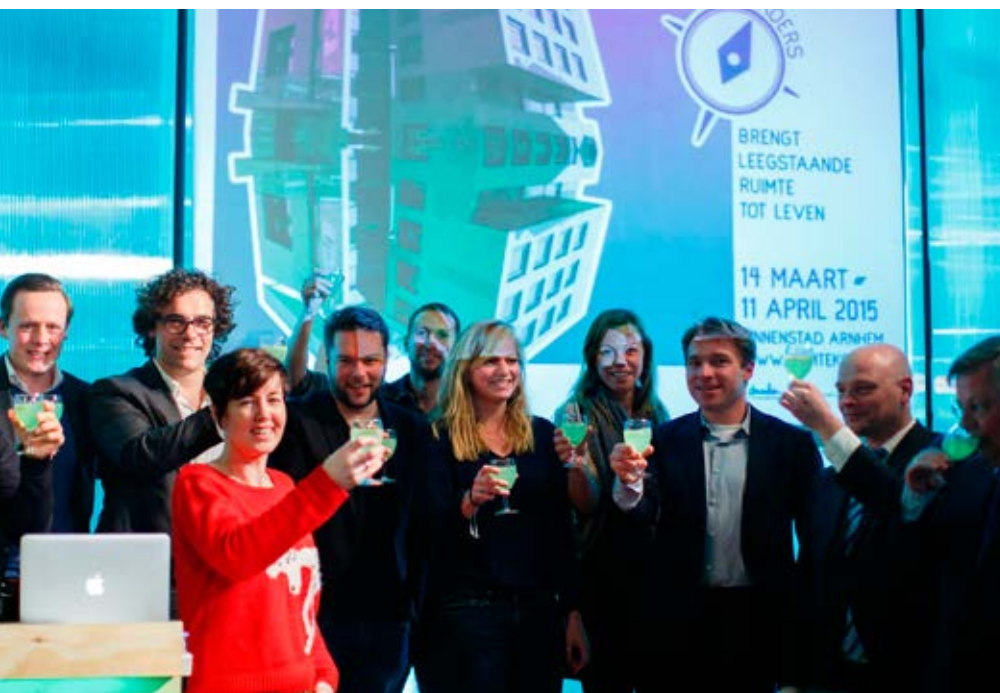
Een toast op de opening van Ruimtekoers Festival