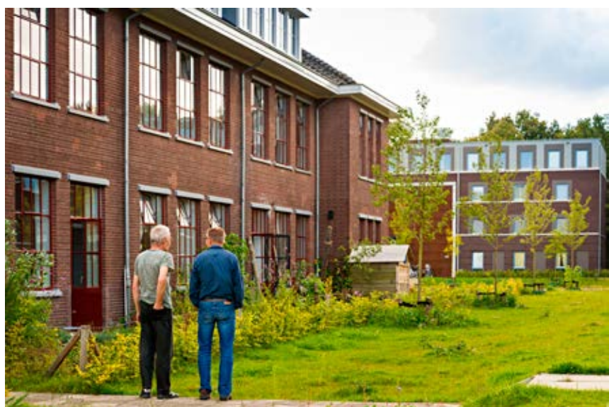
Logiesgebouwen Saksen Weimar