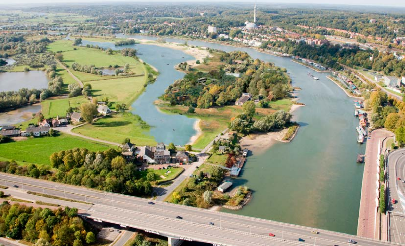
Impressies van Meinerseiland